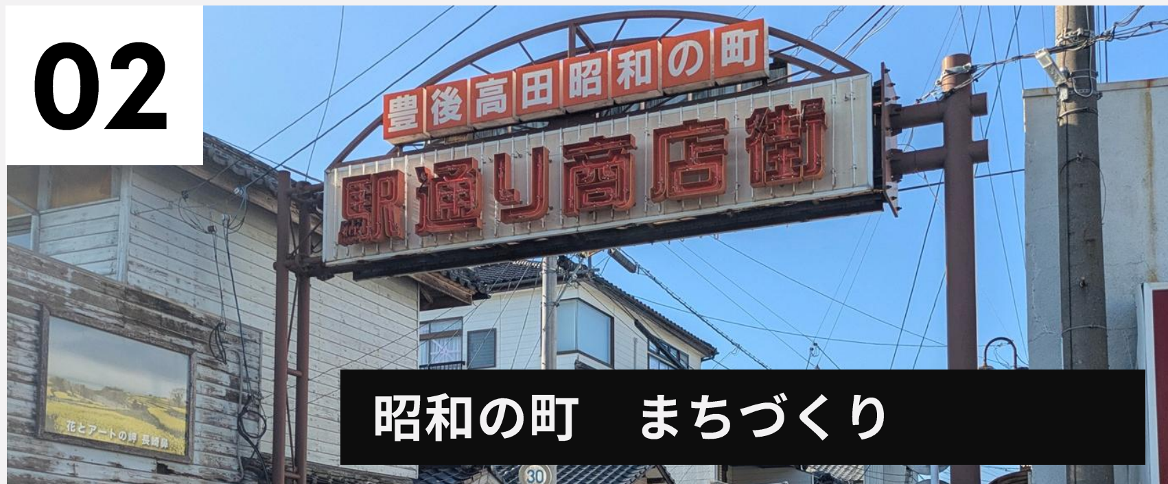
昭和の町 まちづくり