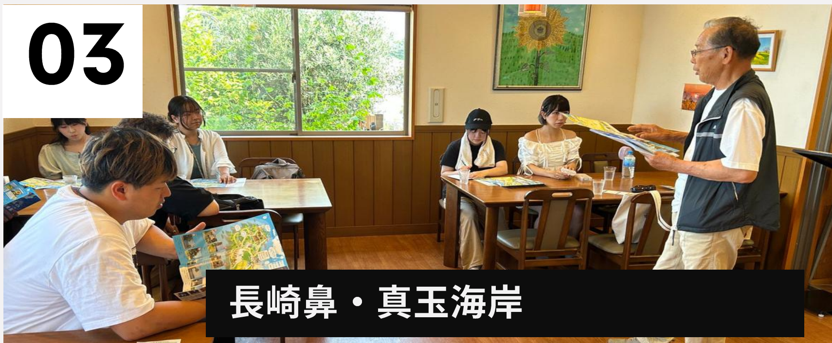
長崎鼻・真玉海岸